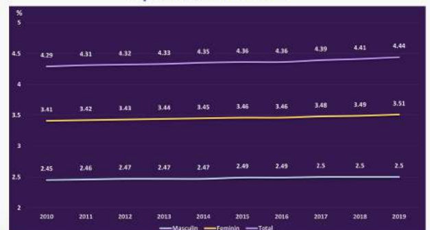
Prevalența depresiei (%) în România, pe genuri, în perioada 2010-2019 3

Prevalența tulburărilor mintale și de comportament în România a crescut constant în ultimii 10 ani, astfel de la valoarea de 1566,3 0 / 0000 de locuitori în anul 2012 a ajuns la o valoare aproape dublă de 2889,9 0 / 0000 de locuitori, în anul 2021.