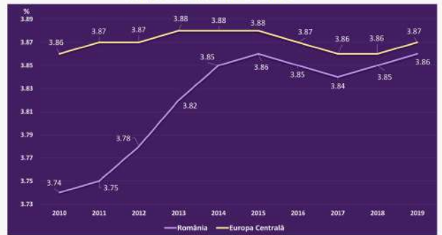
Prevalența anxietății % comparativ România-Europa Centrală, în perioada 2010-2019 3

În perioada 2010-2019, prevalența depresiei în România, pe genuri înregistrează un platou aproximativ, la femei aproape dublu față de bărbați.